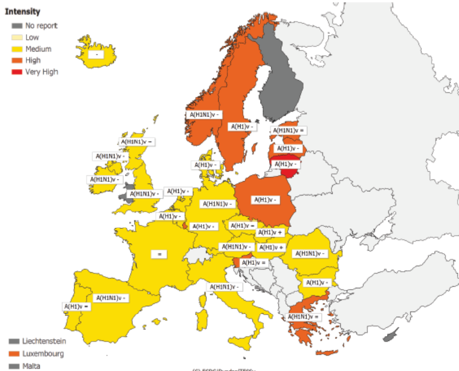
Map 1: Intensity for week 49/2009